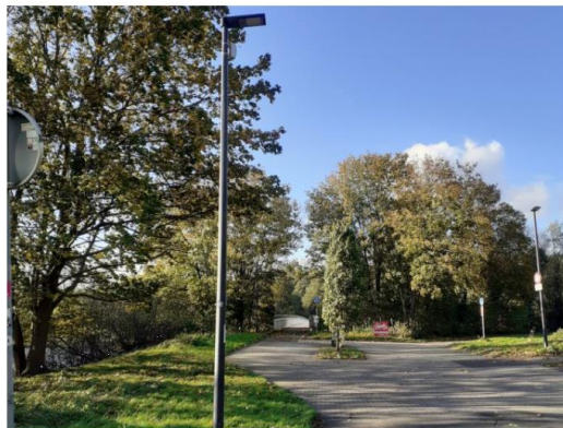
An dieser Stelle hängt die Kamera, mittels der Besucher am Kemnader See auf dem Ruhrtalradweg in Hattingen gezählt werden.